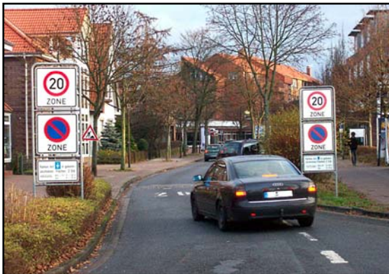
Zonenbeginn (hier in der Mühlenstraße)

Die Regelungen gelten für das gesamte Gebiet (siehe Übersichtsplan) und werden innerhalb der Zone nicht wiederholt.